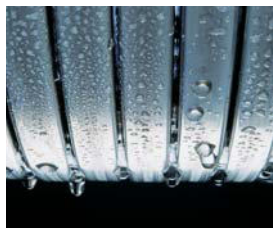
Inox-Radial-Wärmetauscher – langlebig und effizient