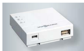
Vitoconnect mit Anschlüssen für das Steckernetzteil (links) und zur Datenverbindung