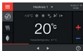
5-Zoll-Farb-Touch-Display der Regelung Vitotronic 200 (Typ HO2B)

* Voraussetzungen und Produktübersicht unter www.viessmann.de/garantie